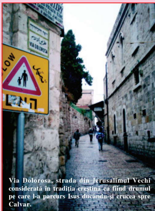
Via Dolorosa, strada din Ierusalimul Vechi considerată în tradiția creștină ca fiind drumul pe care l-a parcurs Isus ducându-și crucea spre Calvar.