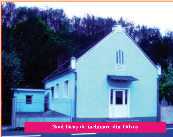
Noul lăcaș de închinare din Odvoș