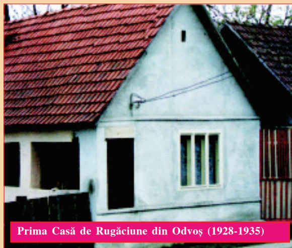
Prima Casă de Rugăciune din Odvoș (1928-1935)

La întâlnirea cu frații de credință, le povestește acestora cele întâmplate și le propune să treacă la penticostalism. Propunerea sa este acceptată de majoritatea credincioșilor, până la urmă doar trei familii nu urmează la noua credință.